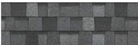
Slatestone Gray 1