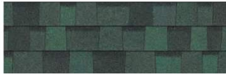
Chateau Green 1