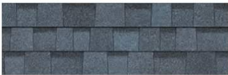
Harbor Blue 1