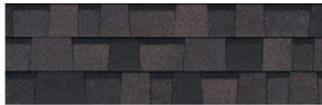
Midnight Plum 1