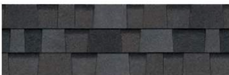
Williamsburg Gray 1