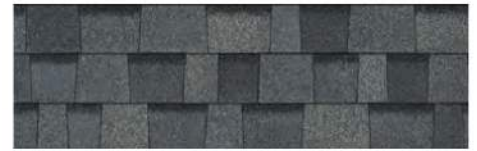
Estate Gray 1