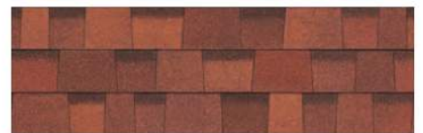
Terra Cotta 1