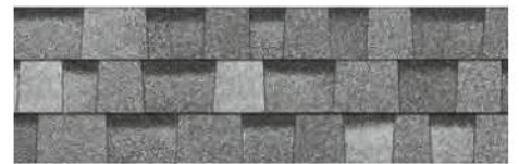
Sierra Gray 1