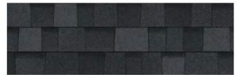
Onyx Black 1