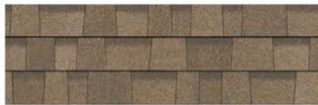
Sand Castle 1