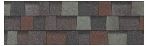
Colonial Slate 1