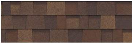
Desert Rose 1